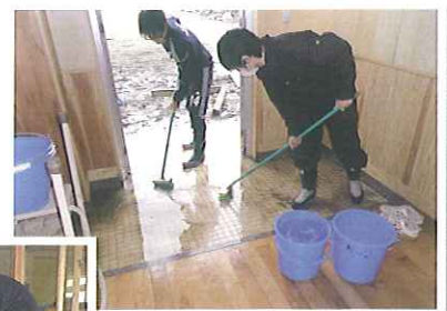
気仙沼市立鹿折小学校にて