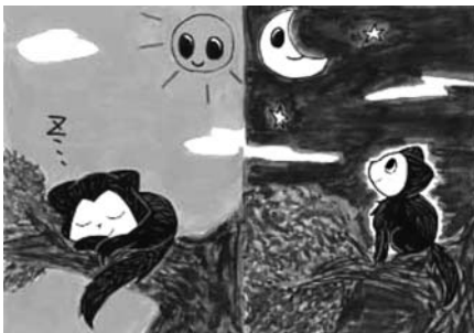
図4. アイアイの紙芝居

りに向けた協力を行っている。技術の移転に関しては、初年度の研修員受け入れ研修（図3）を行うとともに、