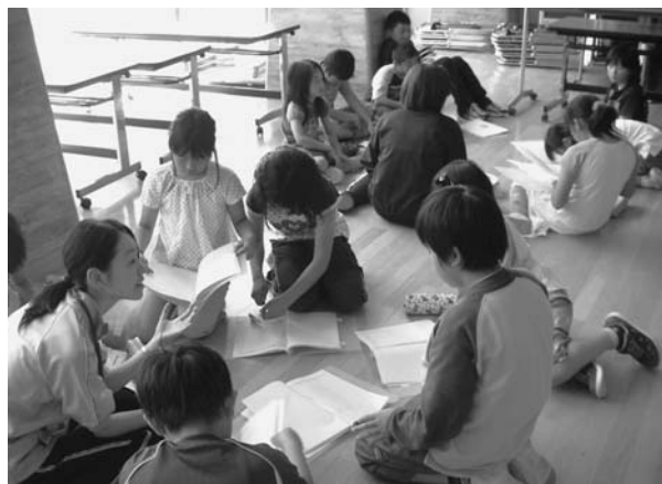
図8. 班ごとのまとめ

そこで、児童たちにアンケートをお願いして、その提出を以て授業の終了とした。アンケート結果は後に載せる。