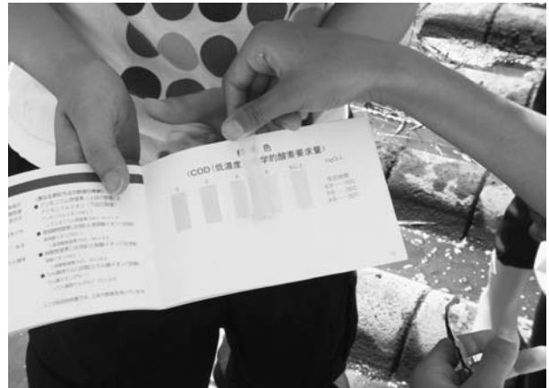
図 5. 瀬峰川・パックテストの結果 (①COD)

(ある児童のノートより、①～③の順に、花山：0, 0.2, 0.02 瀬峰：8, 2, 0.1。水質に大きな差が表れた。)