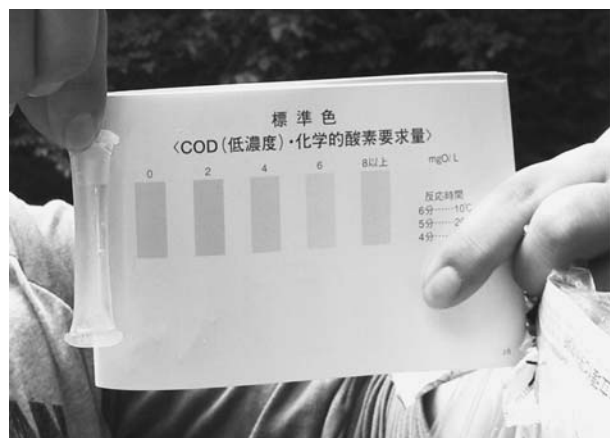
図2. 花山砥沢・パックテストの結果(①COD)

どの値も、数値が高いほど水が汚れていることを示す。花山砥沢におけるパックテストの値はどれも非常に低かった。児童はこれらの値を化学的に理解しているようには見られなかったが、自分たちが予習してきたことや学生の解説から、花山砥沢の水がきれいに澄んでいることを確認することができたようだ。