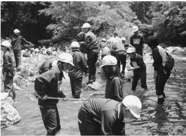
図 3. 花山砥沢・水生昆虫採取