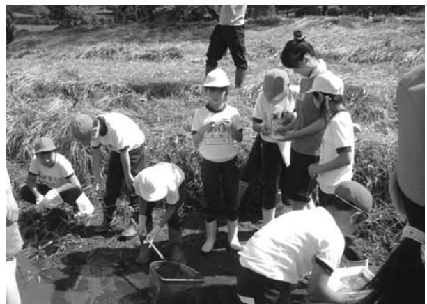
図 6. 瀬峰川・水生昆虫採取

水生昆虫の採取はエビがほとんどであった。花山との比較に使う昆虫はなかなか採られなかった。児童たちは小さな魚たちが気に入ったようで、少しでも大きい魚を