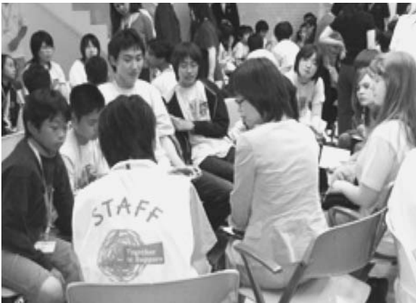
図 3. 話し合い活動の様子

大気汚染、水質悪化、土壌汚染、地球上の各地で起こっている生物の絶滅などの問題点を指摘していた。その上で改善するための処方箋は「個人の選択」にかかっているという。その選択を環境に優しいものにするための啓蒙活動が最も重要であると指摘していた。