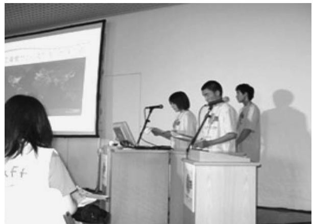
図 4. 加茂中学校の発表の様子

仙台市の代表として参加した加茂中学校では「光害調査活動の成果とその環境教育的な意義」（長島ほか、2003、2006）を報告した。図 4 は加茂中学校の生徒が発表を行っている様子を示している。