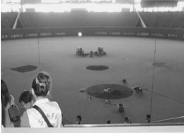
図2. 自然光が取り入れられた札幌ドーム

これらの施設見学を通して地方行政における環境への対策について子どもたちは学ぶことができた。