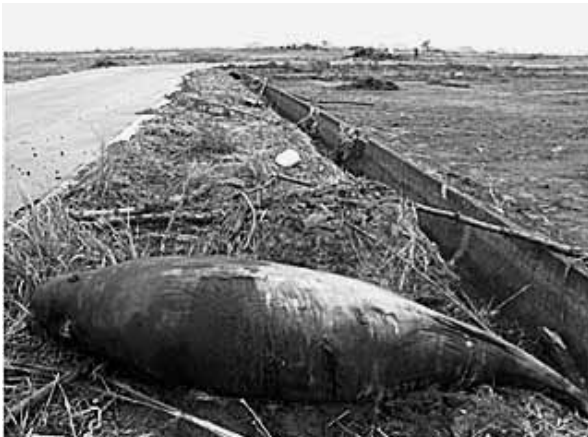
図2. 津波で運ばれたスナメリ(仙台市若林区荒井)

2011年4月24日に宮城県仙台市若林区荒井で本種の死体が発見され、5月1日に現地で調査を行った(図2)。