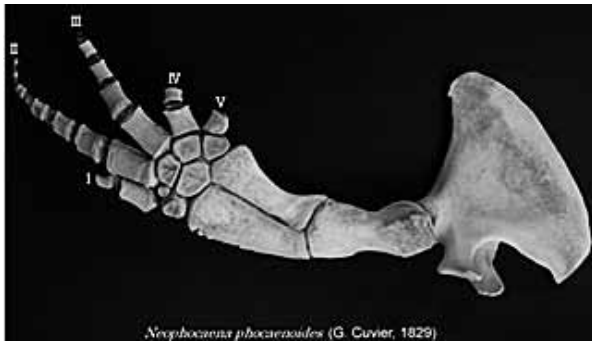
図6. スナメリの右胸びれ