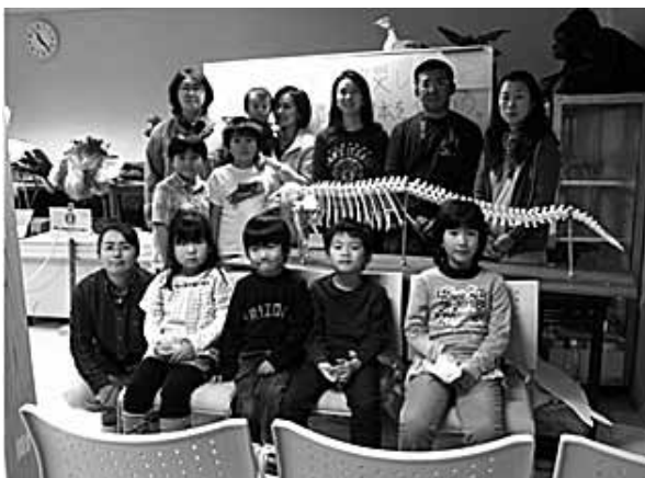
図7. ワークショップの参加者と（八木山動物公園）

このワークショップでは、まず、当日参加した親子ら11人に、仙台湾に生息する本種について説明した後、胸びれ、癒合した頸椎など各部位の特徴や機能を解説し、さらに津波で運ばれた際に骨折したと思われる左胸びれの様子から本個体への理解を深めてもらった。最後に、あえて完成を控えて残した11個のV字骨の意味（血管束の通路）を説明してから、参加者各自がひとつずつ取り付け作業をした。参加したある母親は「大変貴重な体験をさせてもらった」と喜んでいった（図7）。完成した本種の骨格標本は、「環境教育ライブラリーえるふえ」に収蔵され、2012年2月に仙台市八木山動物公園ビジターセンターで一般公開を予定している。