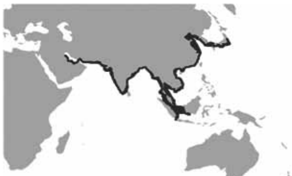
図1. スナメリの生息域

スナメリ Neophocaena phocaenoides は鯨偶蹄目ハクジラ亜目ネズミイルカ科スナメリ属に属する。本属は1属1種である。その分布は、西はペルシャ湾から東は仙台湾までの間のインド、東南アジア、東アジアの沿岸水域と大河の中流域で、日本における地域個体群のなかでも仙台湾の個体群は極東および北限に近い個体群として、世界的にも注目されている（図1）。