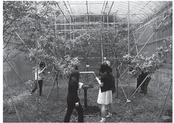
図5. さとやま昆虫ハウス

カブトムシの生態や集団行動の観察、飼育技術の獲得、観察者（園児・児童・生徒）とのふれあいを通じた学びが行われる。カブトムシや国蝶オオムラサキを自然に近い状態で観察でき、本学学生にとっては、里山が育んだ生物多様性や里山の維持・管理の重要性等について、体験を通して理解を深めるよい機会となっている（図5）。