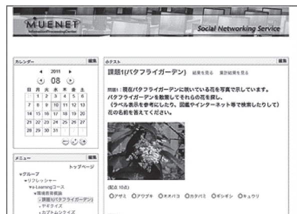
図3. 授業支援システム(一部)