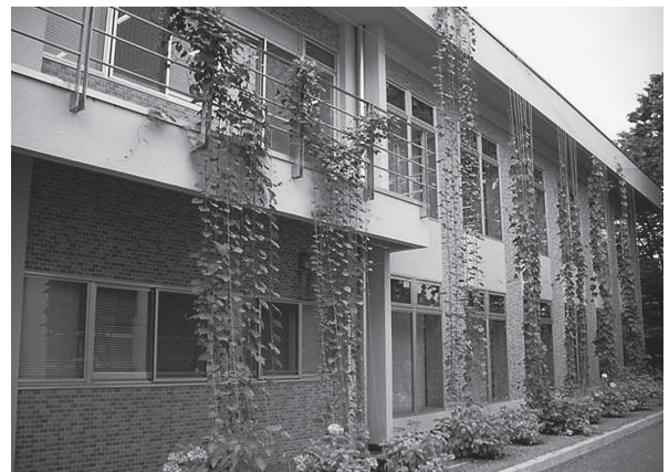
図6. グリーンカーテン