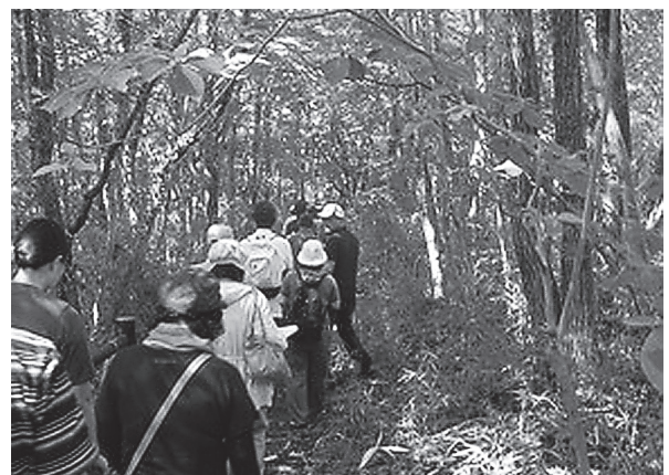
図14. 教員免許講習 (青葉山キャンパス内フィールドワーク)

平成22年から3年計画で、フィールドワークという体験を基底として、体験型の教育方法の獲得、それを実施するために必要な専門力の確認・再構築等を実施できる教材園の整備を進めてきた。この3年間で、学生の教育力向上のための学びの場・検証の場としての機能を教材園にもたせた。しかし、支援システムの整備については幾つかの課題も残されている。例えば、実習者の実体験にもとづく教育力の検証と評価に関する支援のあり方と方法は今後も継続して検討を進める