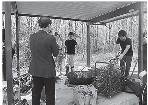
図13. 教材研究 (炭焼き) (環境教育コロキウム)