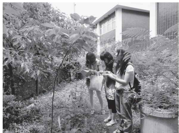
図2. 音声ガイドを活用した観察

動物の飼育活動の体験を通して、飼育技術を学び、動物を活用した授業づくり・学級づくりを目指した基