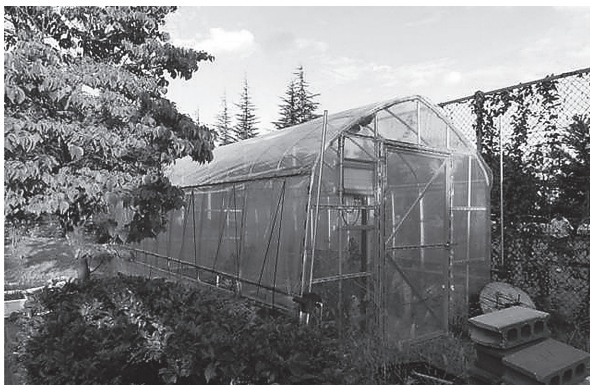
図11. 附属中学校 温室