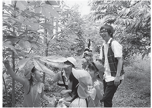
図12. フレンドシップ授業 (バタフライガーデン)