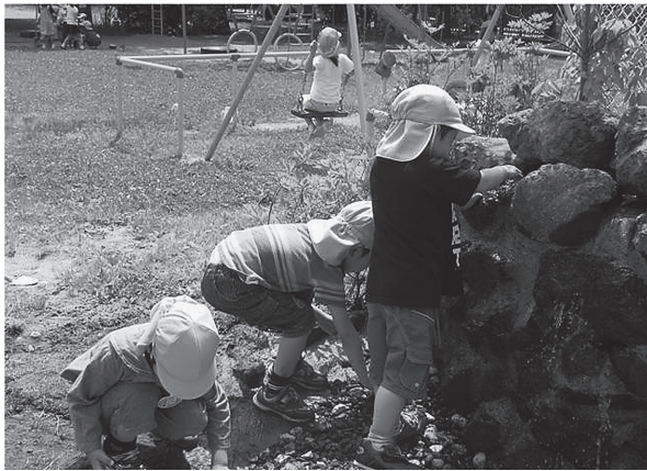
図10. 附属幼稚園 ビオトープ池