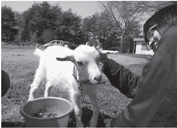
図4. ヤギの飼育活動

礎トレーニングを行っている。動物（ヤギ、ウサギ）を育て、動物のフンを使って堆肥をつくり、さらにその堆肥をつかって野菜を育てるといった体験活動が行われる。さらに、地域との連携・協働として、観察・ふれあい、チーズづくり、飼育に関する体験プログラムの作成や、大学外（児童館、学校、市民センターなど）にヤギを出前し、学生参加のふれあい活動も行っている（図4）。