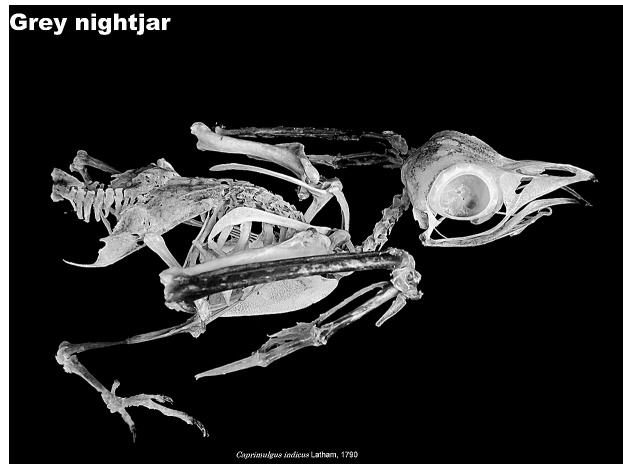
図4. ヨタカ全身骨格標本(右側面観)