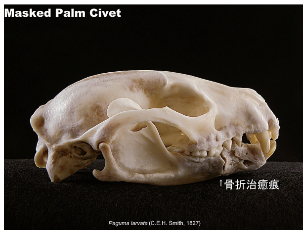
図10. ハクビシン(右側面観)