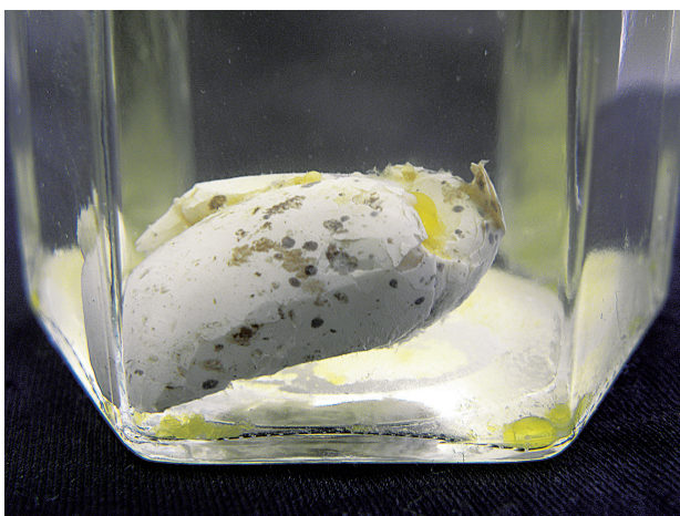
図3. 液浸標本にした卵