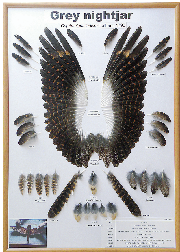
図5. ヨタカ(メス)の羽標本完成図