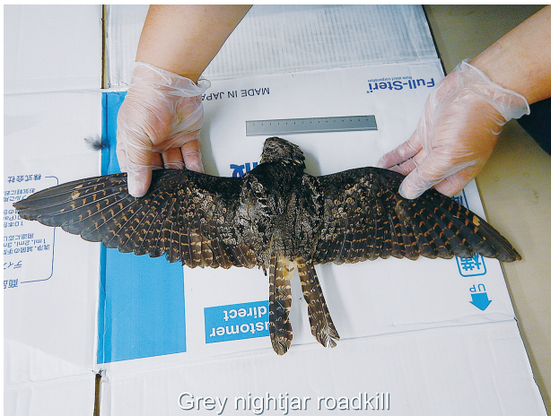
図1. 回収直後のヨタカ