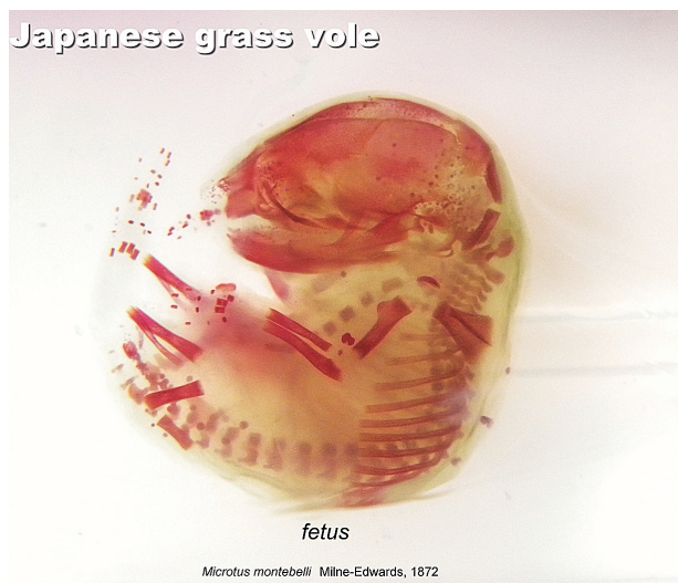
図9. ハタネズミ胎児の骨格