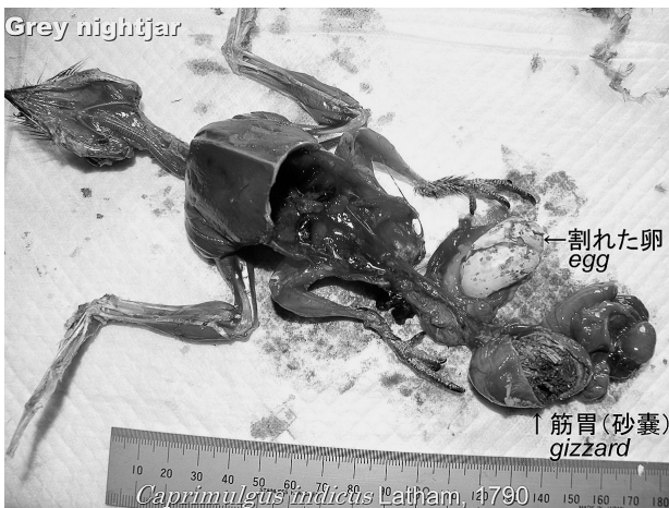
図2. ヨタカ体内の卵と筋胃