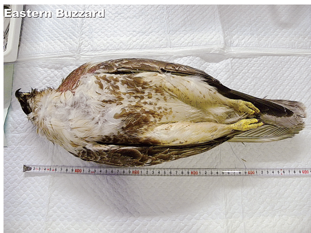
図6. 解凍後のノスリ