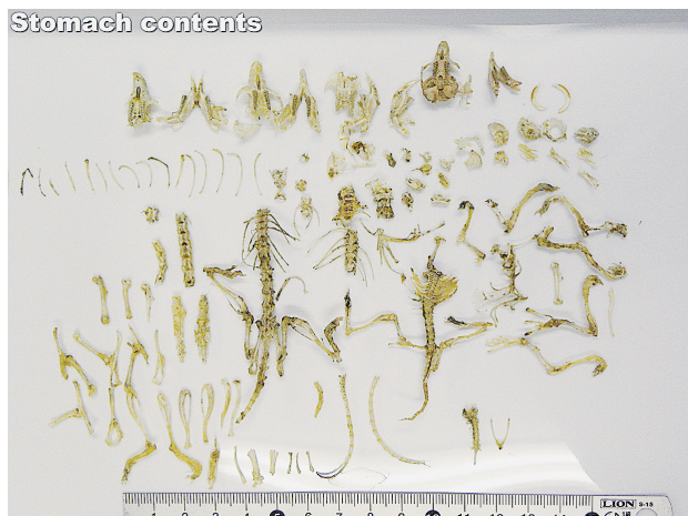
図7. ノスリの未消化物