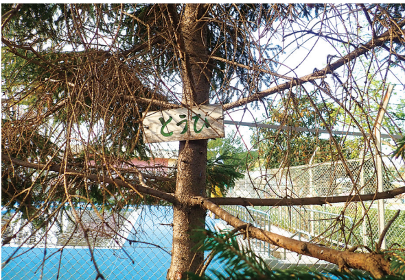
図2. 2003年当時に樹木につけられた名札

高橋らの研究から15年あまりが経過した現在、附属幼稚園の樹木相がどう変化したのかを把握するため、筆者らは2019年度に園内研究などの機会を利用しながら、附属幼稚園の樹木調査を実施することにした。調査方法は基本的に高橋ほか（2004）を踏襲し、附属幼稚園の敷地に生育しているすべての樹木（ただし、樹高が50cm以上の木化した多年性の幹を有する植物に限定した）について、種名ならびに位置を個体ごとに調べ、樹木一覧ならびに樹木位置図を作成した。