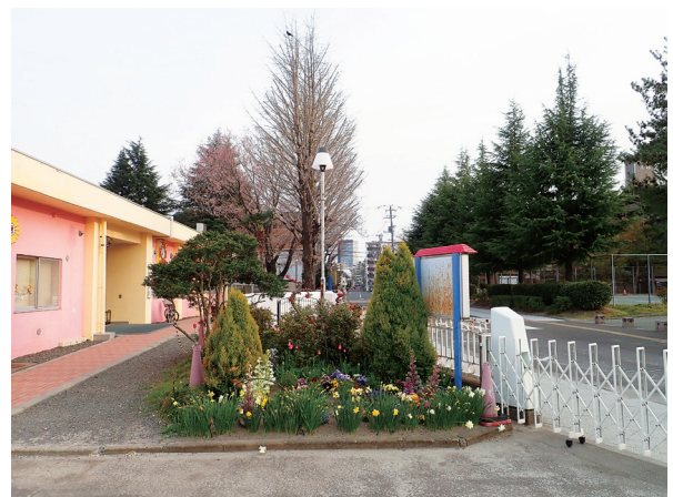
図3. 建物入り口北側の植栽