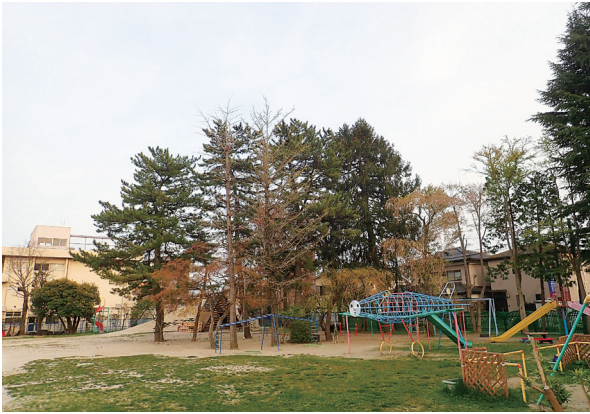
図1. 樹木と遊具に囲まれた附属幼稚園の園庭