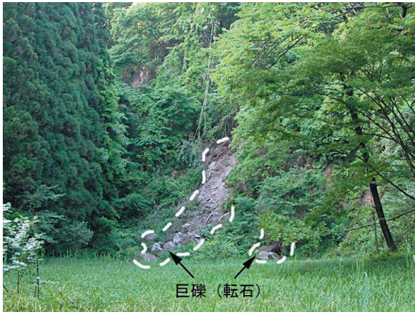
図2 滑落崖下部にみられた巨礫(転石)群(地点1)。