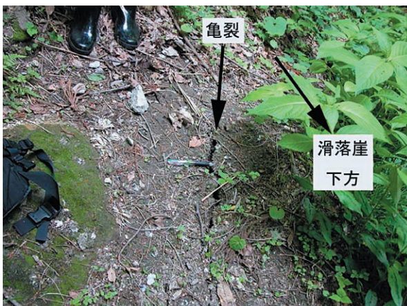
図3 地点2で観察された亀裂。幅2cmほどの亀裂が滑落崖と並行する方向に数mにわたって断続的に伸びていた。