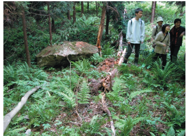
図5 滑落崖直下の巨礫(中央やや左側)とその落下・衝突に伴って折損した杉(地点3)。