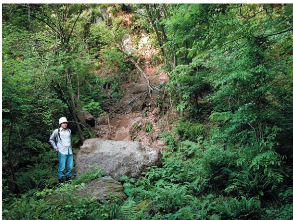
図4 滑落崖直下の巨礫とその移動経路に沿って破壊された植生(地点3)。